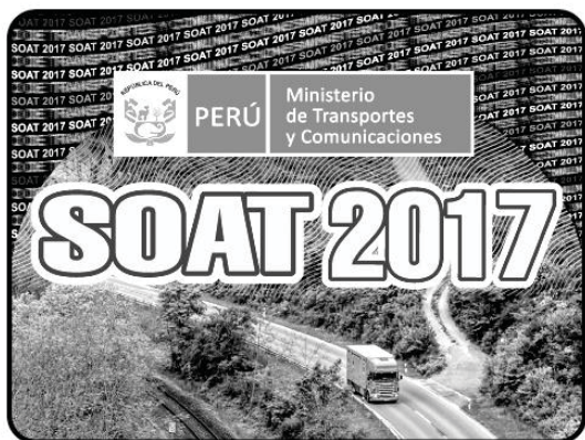
IMAGEN DEL HOLOGRAMA